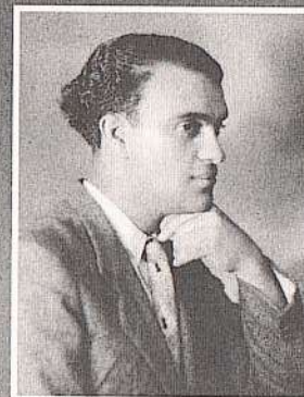
FRANCISCO CÂNDIDO XAVIER