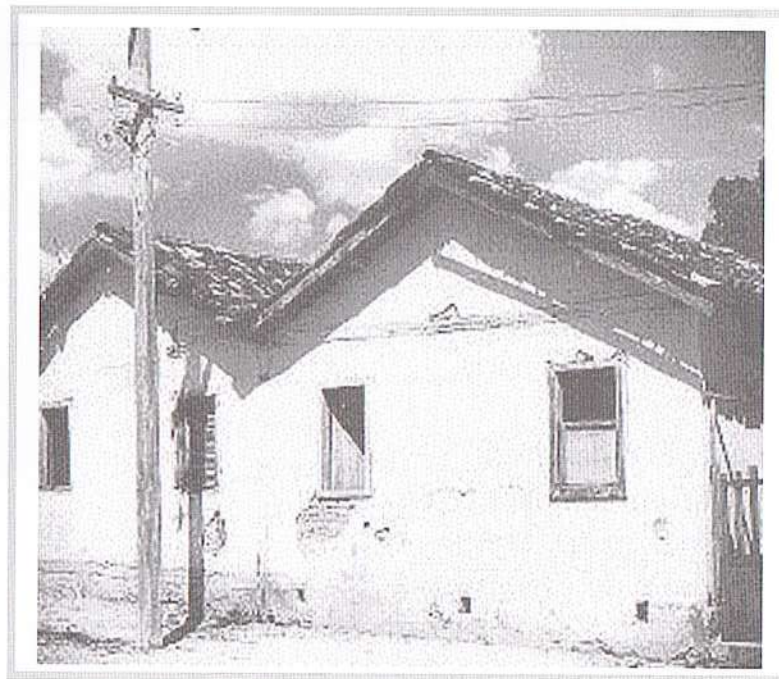
Casa onde nasceu Chico Xavier em Pedro Leopoldo - MG