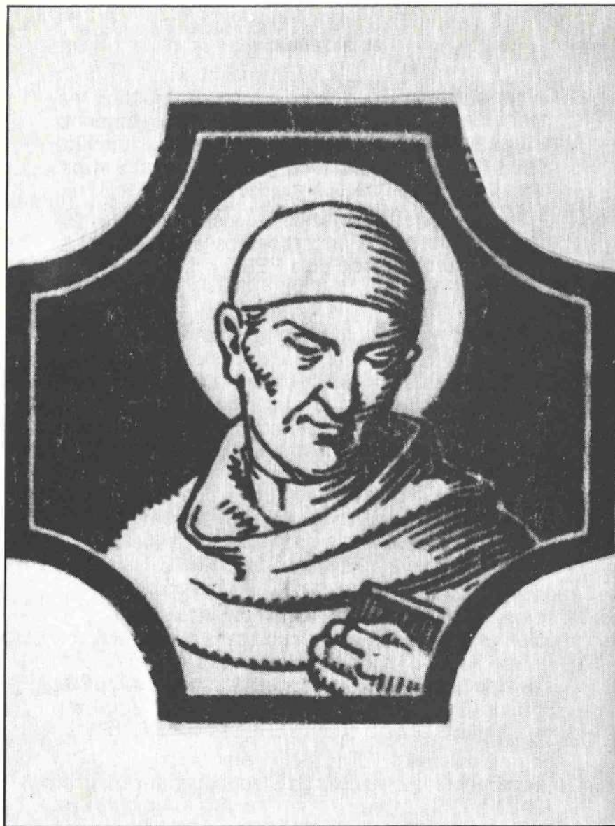
Tomás de Vilanova (Santo Tomás de Villanueva)