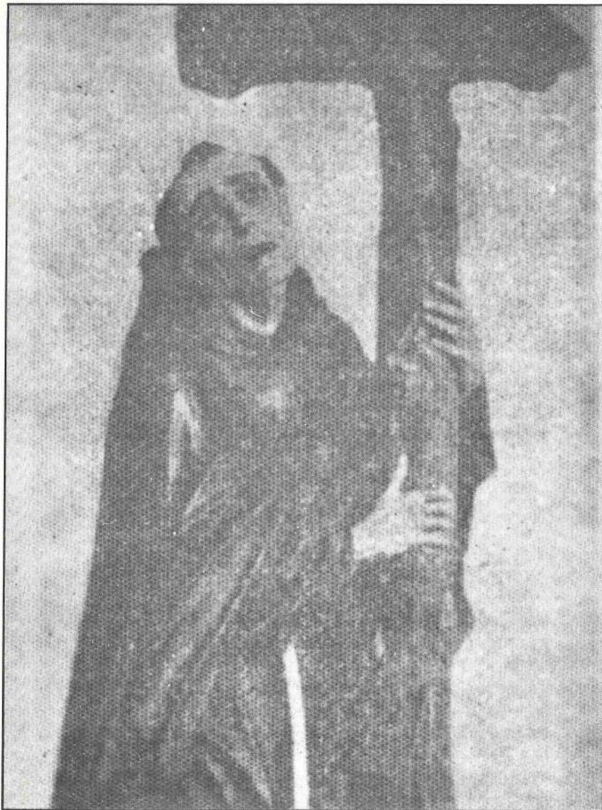
Frei Pedro de Alcântara (1499 – 1562)